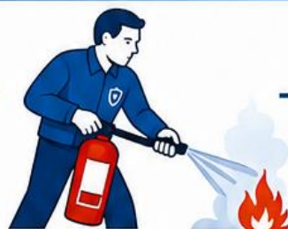
ДЕЙСТВУЙ ПО ОБСТАНОВКЕ