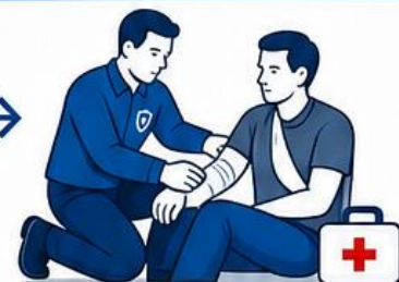
ОКАЖИ ПЕРВУЮ ПОМОЩЬ